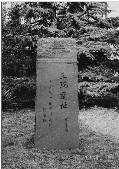
“三院遗址·清华第一个中共支部诞生地”纪念物