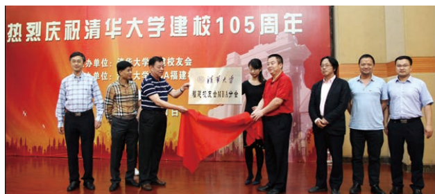
清华大学福建校友会MBA分会揭牌