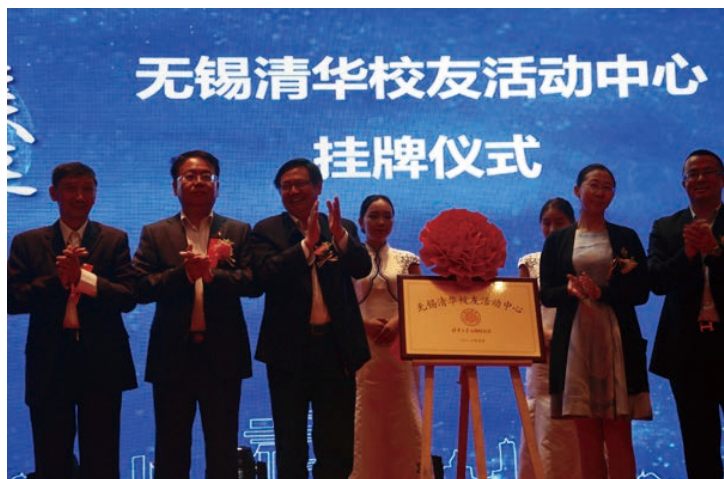
无锡清华校友活动中心揭牌

随后进行了启迪协信无锡科技城揭牌仪式和启迪协信无锡科技城落户梁溪区的签约合作仪式。大会上还宣布了清华大学无锡校友会与启迪协信科技城共同合作，在启迪协信科技城建立无锡清华校友活动中心，举行了揭牌仪式，并进行“产研兴城聚势无锡”高峰论坛。