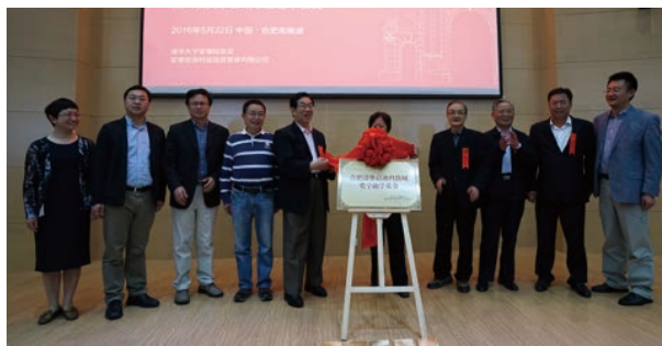
“合肥清华启迪科技城奖学助学基金”揭牌仪式

起“合肥清华启迪科技城奖学助学基金”。现场进行了基金揭牌仪式和与安徽校友会与六校(巢湖一中、巢湖四中、合肥六中、合肥八中、合肥168中学、合肥一中)签署捐赠合作协议。