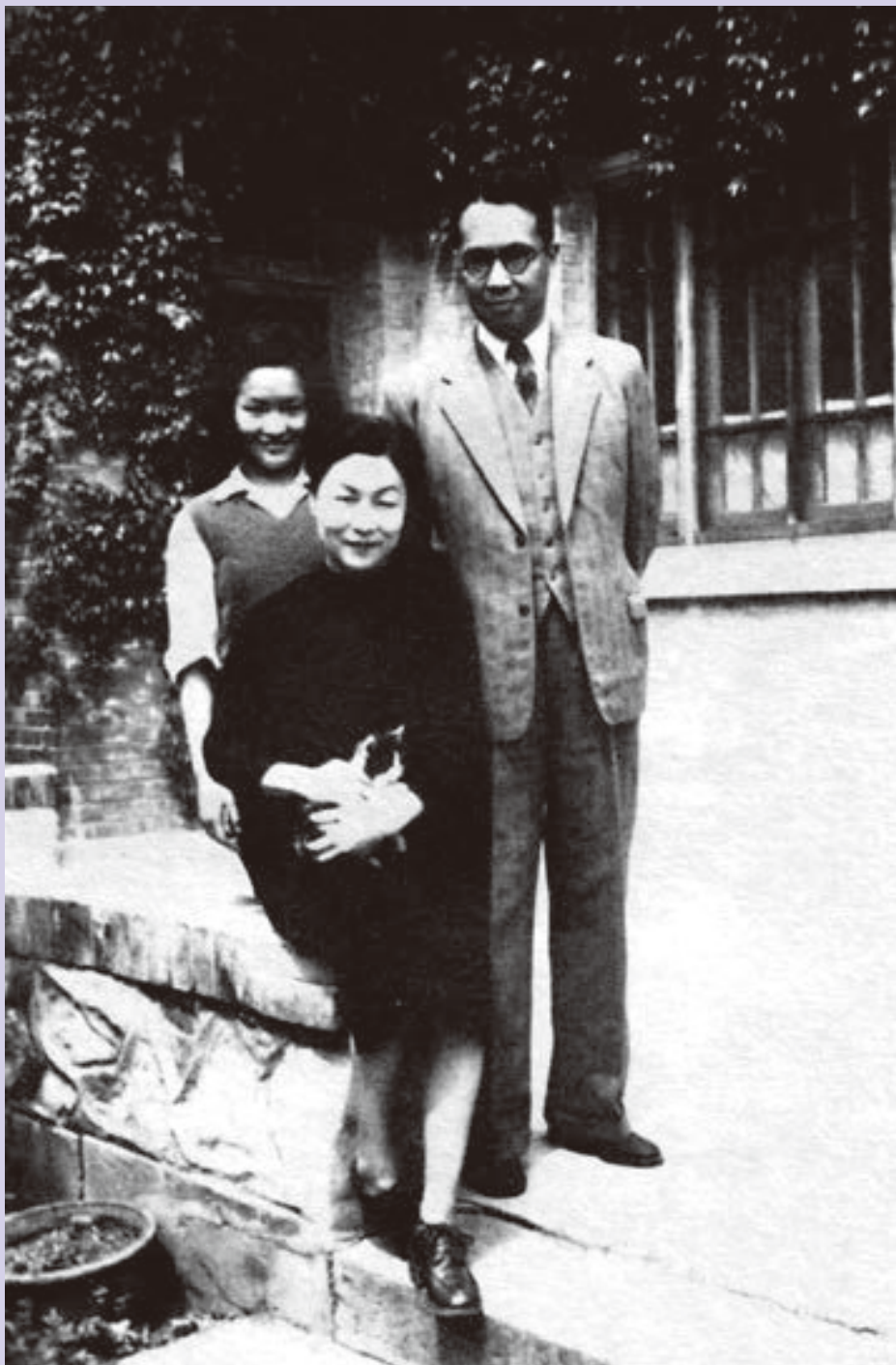
钱钟书、杨绛一家在清华新林院7号合影