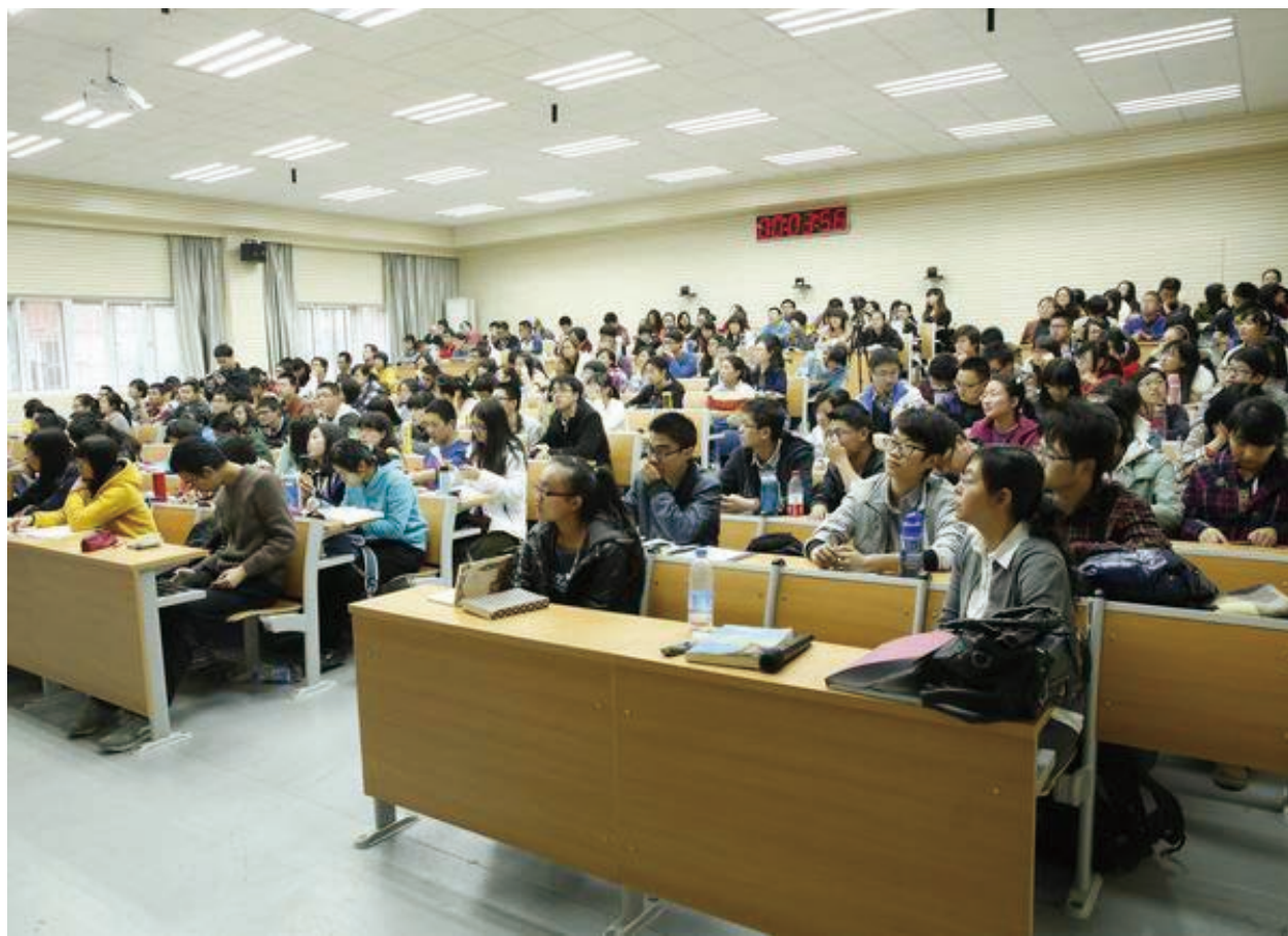
座无虚席的大教室

方教授指出,上小班课不同于上大课,前者 需要师生进行更多的互动,因此也需要更加舒适、 单纯的沟通氛围。