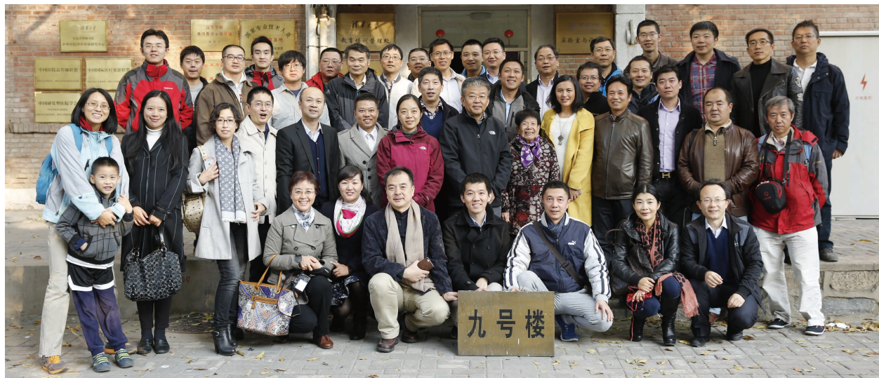
九号楼拆除前的校友活动

● 在九号楼即将拆除的前一个星期，系里还举办了“杯酒人生”鸡尾酒会，地点就设在已经