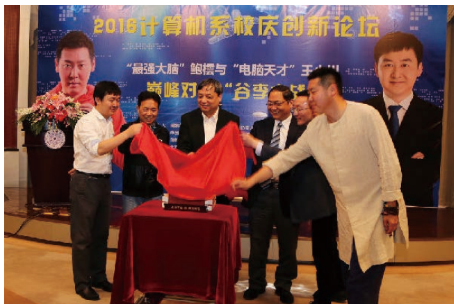
“九号楼纪念砖”发布仪式上，嘉宾们共同为“九号楼纪念砖”揭幕