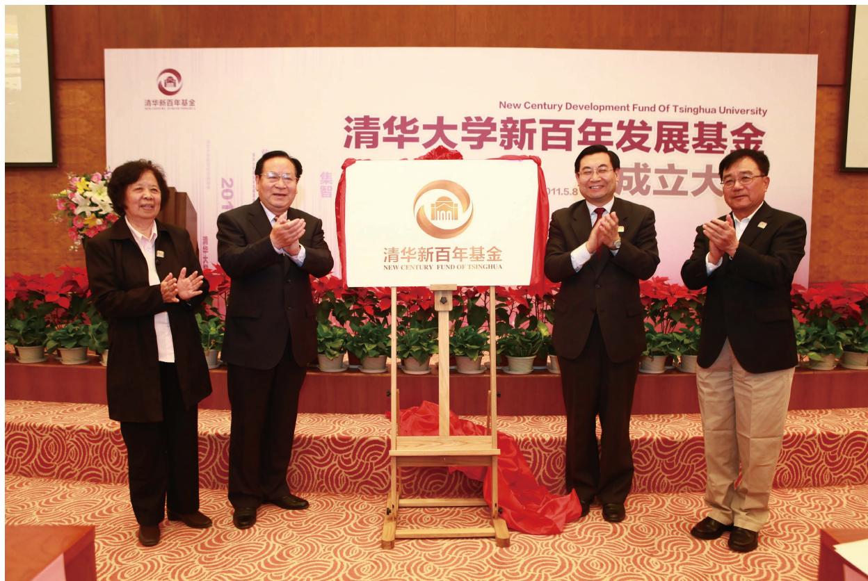
清华大学新百年发展基金成立仪式