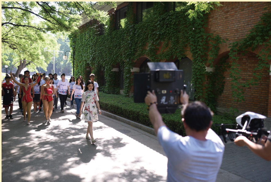
iTsinghua 自定义 2016 年清华大学招生宣传片拍摄现场

iTsinghua 学堂体现了清华大学的一贯理念，即招生就是培养，招生为了培养，招生促进培养，这种将招生按照育人的方式展开，延伸服务、深度服务的做法，体现了清华大学的人才选拔理念，也凸显了清华人的社会担当。通过这个活动，全国中学看到了清华求才若渴的立场和态度，看到了清华让招生回归教育本质，回归人才培养本身的决心和信心。