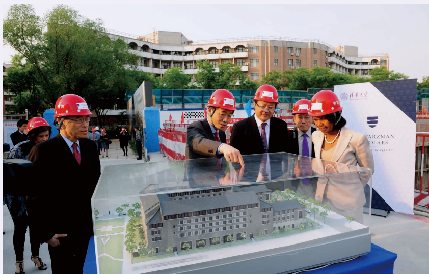
2014年4月27日 美国前国务卿康多莉扎·赖斯（右一）访问清华大学苏世民学者项目，右三为时任清华大学校长陈吉宁

我们很希望在全校范围内，教师国际化的程度能够提高。世界上很多大学，比如新加坡国立大学、新加坡南洋理工大学、法国巴黎大学、香港科技大学，都是在世界范围内广纳贤才，发展得非常快。尤其是香港科技大学，在全球招聘老师，近几年发展得非常好，世界排名中屡屡超过清华。我们现在所做的一些努力，也是为将来的