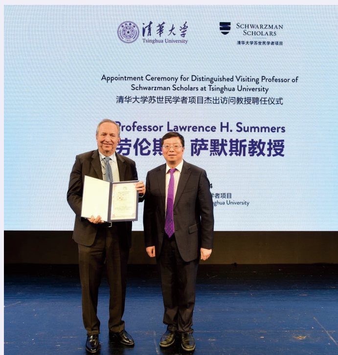
2015 年 11 月 4 日，清华大学校长邱勇向美国前财政部长、哈佛大学前校长劳伦斯·萨默斯颁发“清华大学杰出访问教授聘任证书”

潘： 书院根据清华大学研究生招生的各项规定制订了科学严谨的招生录取标准和流程。在选拔过程中全程没有设置笔试。在申请阶段，学生需要提交给我们四篇小论文，包括自我陈述，自选时事题目论述、领导力论述等，推荐信、社会活动、公益活动经历等也都是我们初步评审的依据。