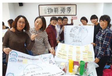
学员开展行动学习

司法培训主要面向全国政法系统在职人员、企事业单位法律类专业人才和各级党政机关行政执法干部开展培训，逐步形成了自身的品牌特色和专业的课程体系，数次获得荣誉奖项。目前已为各级政府机关累计培训