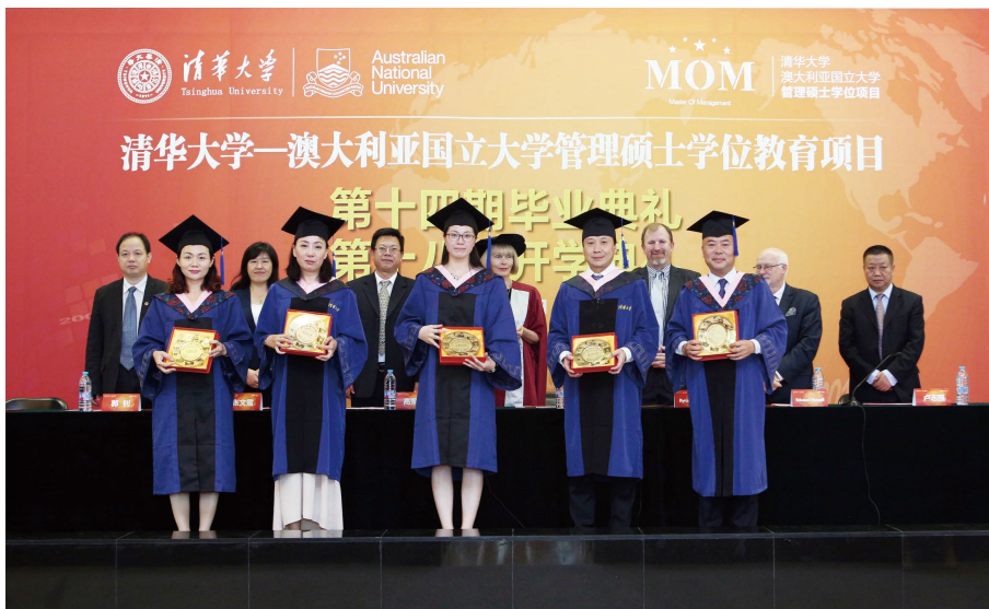
清华大学—澳大利亚国立大学管理硕士学位教育项目典礼

秉承“融汇中西”的办学理念，聚焦国际化人才培养，提供国际学位教育、国际管理课程、国际定制课程和留学预备课程等四大系列国际课程，致力于打造中国乃至世界一流的国际教育交流与合作平台。