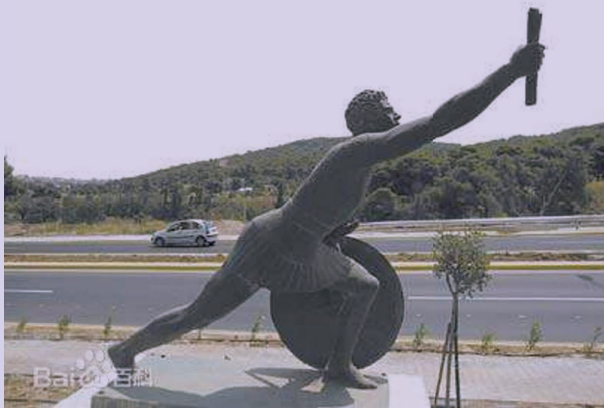
“马拉松第一人”菲迪皮茨的雕像

马拉松的起源要从公元前490年9月12日发生的一场战役说起。这场战役是波斯人和雅典人在离雅典不远的马拉松海边发生的，历史上称为希波战争。