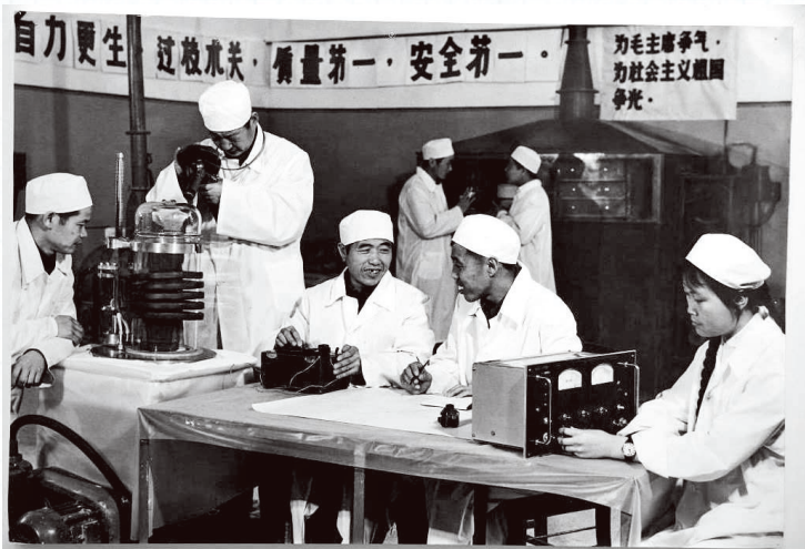
当年的两弹一星元勋们群策群力攻克技术难关

要协调、绿色、开放、共享发展的整体实施来落实；同时，协调、绿色、开放、共享发展也需要创新发展来高效推动。