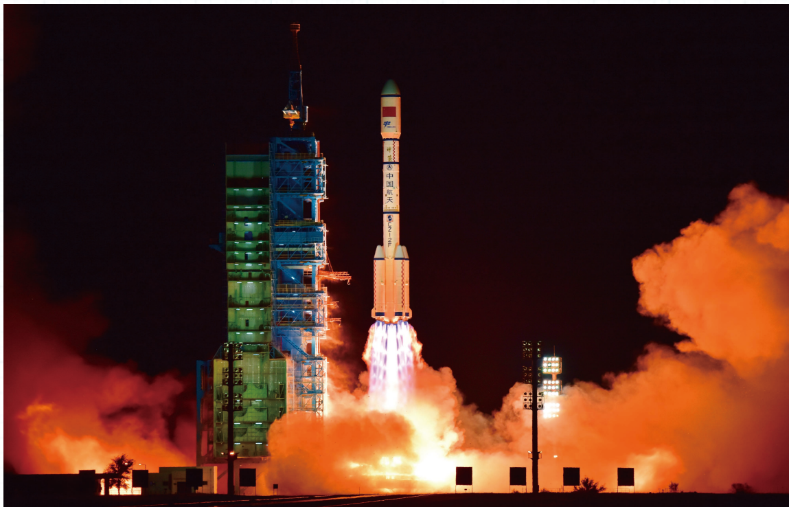
9月15日22时04分09秒,农历八月十五,在甘肃酒泉卫星发射中心,长征二号FT2火箭搭载“天宫二号”正式点火发射。“天宫二号”空间实验室发射后将开展在轨测试并建立自主运行模式,并与神舟十一号载人飞船进行对接

度势,把创新在国家发展中的地位提升到了新的高度。2013年9月,习近平同志在主持中央政治局第九次集体学习时强调,实施创新驱动发展战略决定着中华民族前途命运。全党全社会都要充分认识科技创新的巨大作用,敏锐把握世界科技创新发展趋势,紧紧抓住和用好新一轮科技革命和产业变革的机遇,把创新驱动发展作为面向未来的一项重大战略实施好。2015年10月,党的十八届五中全会把创新放在五大发展理念之首、摆在国家发展全局的核心位置。2016年5月,习近平同志在全国科技创新大会上指出:“实施创新驱动发展战略,是应对发展环境变化、把握发展自主权、提高核心竞争力的必然选择,是加快转变经济发展方式、破解经济发展深层次矛盾和问题的必然选择,是更好引领我国经济发展新常态、保持我国经济持续健康发展的必然选择。”这些重要论述,阐明了创新在我国目前发展阶段的战略地位和重大作用。