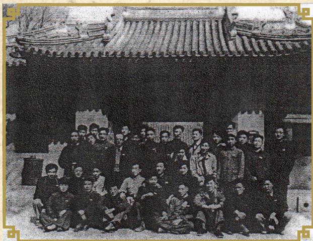
1952年全班同学与陈士骅教授的合影

去年毕业60年聚会，一个甲子过去，时也匆匆，颇多感慨。现将能反映往事的一些图片提供给校友们分享，共同追忆早年的峥嵘岁月，珍惜今天。