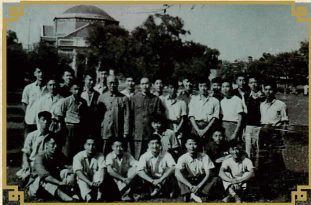
1953年毕业时与蒋南翔、刘仙洲两位校长的珍贵合影