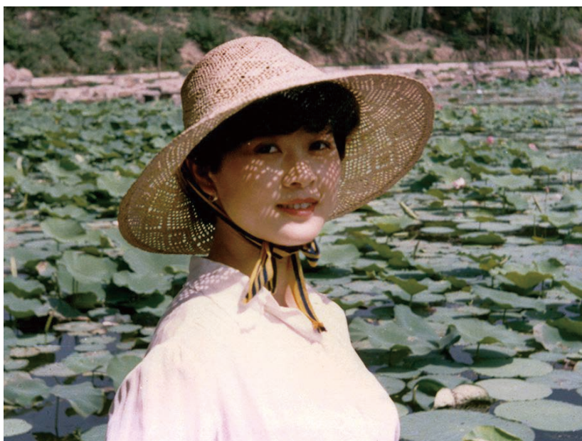
一个清华精仪系光1班女生（1986年）

独当一面，她们敏锐灵活设计不乏独特奇思，她们充满责任担当岗位上总是兢兢业业，她们天生气魄需要时可以率众领军。