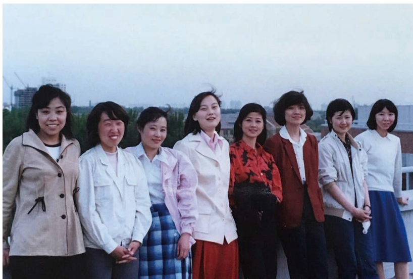
八个清华精仪系光1班女生（1986年摄）