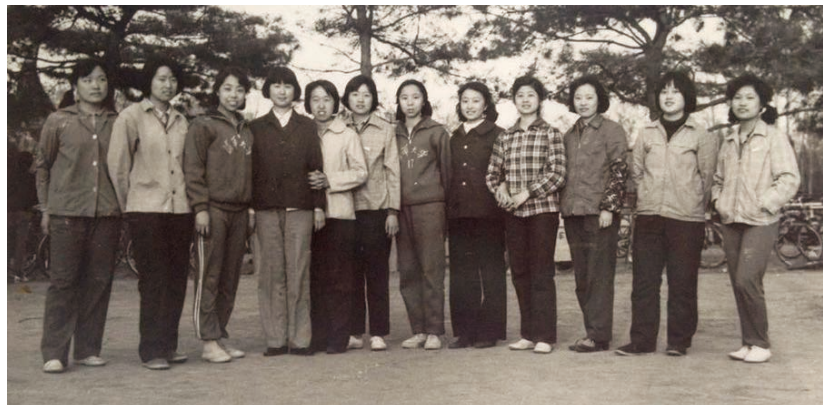
十二个清华精仪系光1班女生（1981年摄）