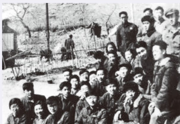
参加“712”项目建设的化工系师生