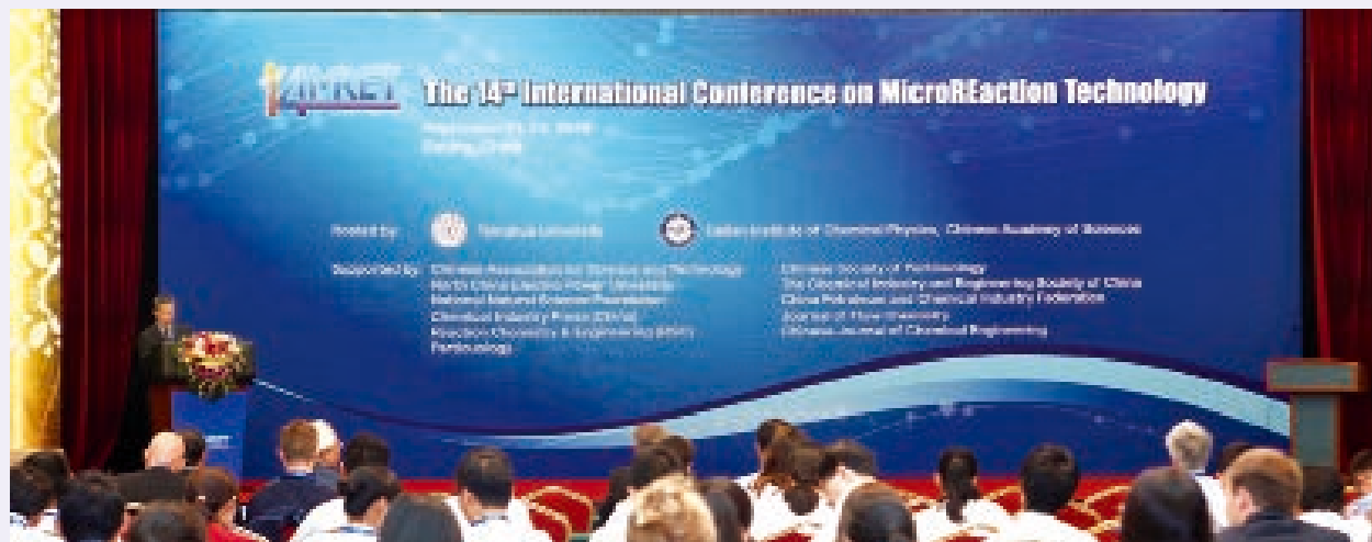
国际影响力不断提升：主办国际微反应技术会议等一系列国际会议