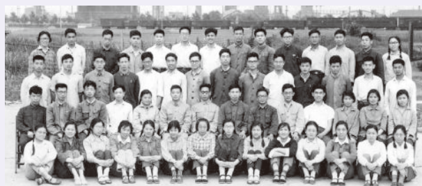
参加聚四氟乙烯中试的化五量五上海毕业实习队留影