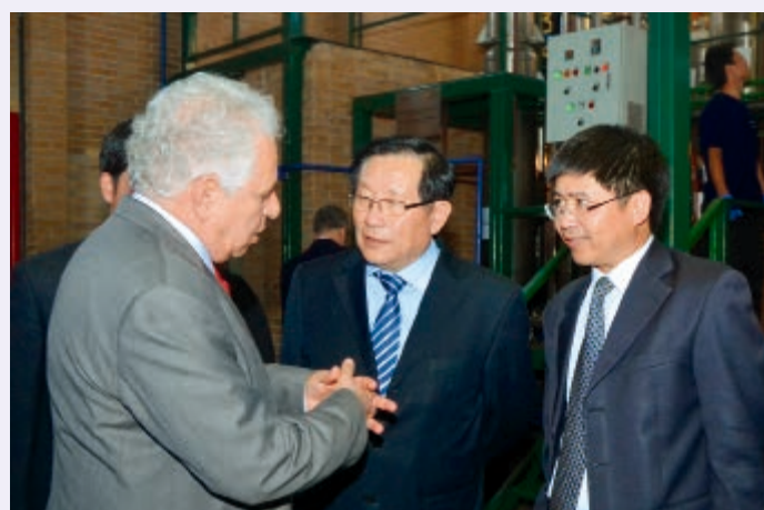
生物能源技术成为中国和拉丁美洲合作的典范， 获批全国首个科技部中拉合作联合实验室