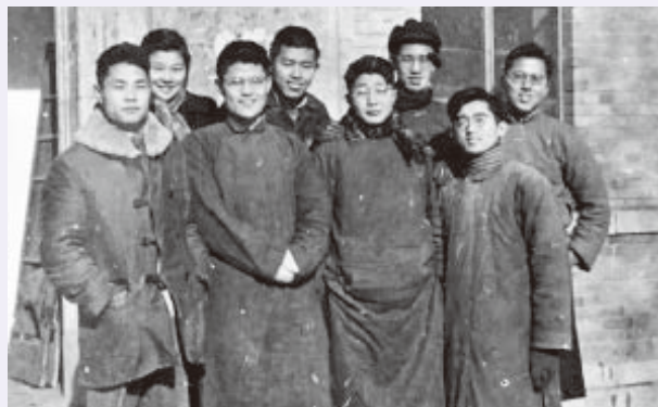
1946 级部分学生在化工原理实验室门口合影