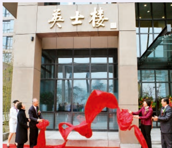
基地建设取得突破：建筑面积 14000 平方米的英士楼投入使用；重点实验室和工程中心快速发展