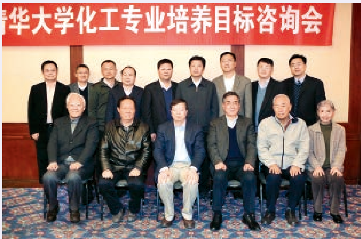
邀请各界知名校友成立清华大学化工系教育咨询委员会