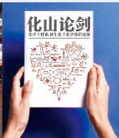
持续建设品牌特色学生学术活动，研究生学术活动月已持续举办 16 届，“化山论剑”新生化工化学知识竞赛已经持续举办 15 届