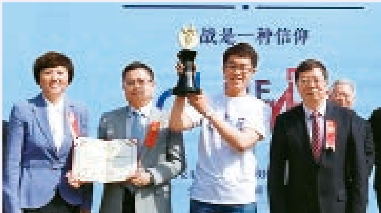
学术课外科技活动有声有色，近年来多次捧得全校团体最高奖“挑战杯”