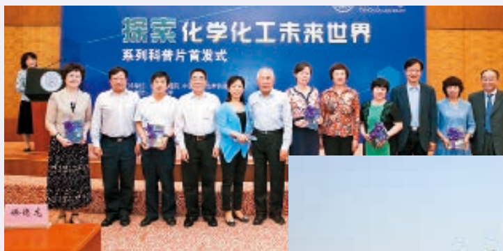
组织和创作《探索化学化工未来世界》系列科普片和科普书，并向全国高中和大学无偿赠送