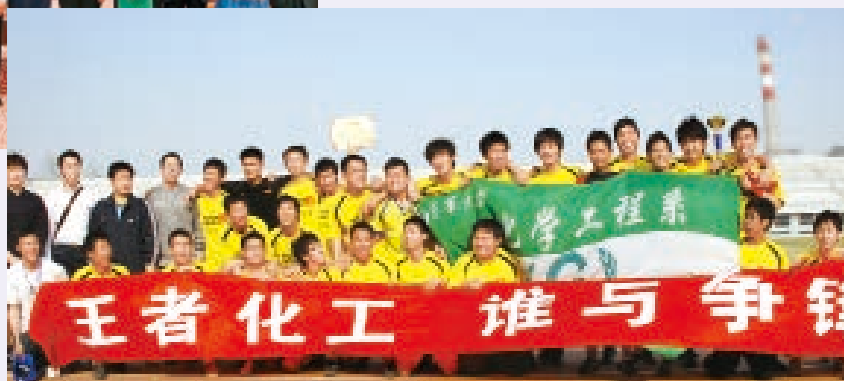
近年来曾四次获得清华大学男子足球冠军，继承并发扬了化工体育精神

才能得到最完美的实现。最后，团支部决定以“从我做起，从现在做起，为实现四个现代化贡献力量”作为这场讨论的结论。这个口号作为清华学生工作总结于1979年首次在清华校刊发表，随后经《中国青年报》报道在社会传播。