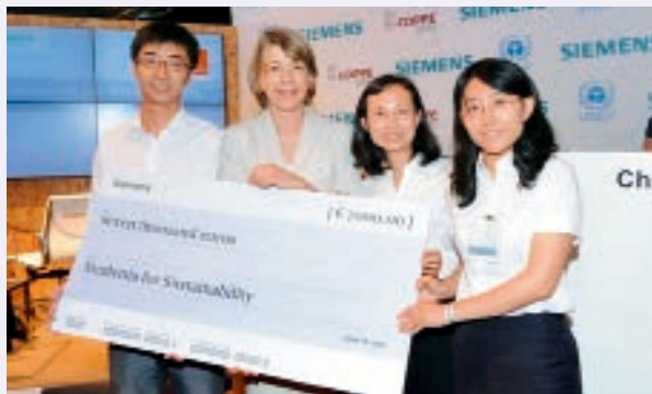
化学工程本科专业“无缺点”地通过 ABET 国际工程教育专业认证 获得国际“大学生可持续发展大赛”冠军