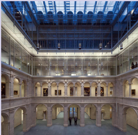
哈佛大学艺术博物馆内景

哈佛大学艺术博物馆由福格博物馆、莱辛格博物馆(1903年建)和萨克勒博物馆(1985年建)组成,馆内藏有来自欧洲、北美洲、北非、中东、南亚、东亚及东南亚等各地区从古至今的藏品约25万件。