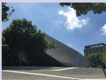
武汉大学万林艺术博物馆