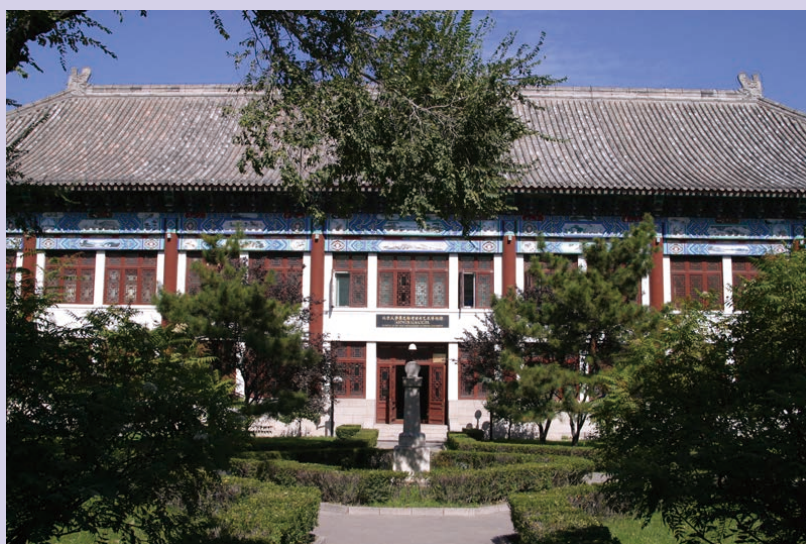
北京大学塞克勒考古与艺术博物馆

我国的大学博物馆之所以鲜为人知，因为博物馆仅作为学校内部的一个部门，总是关起门来做事。大学的博物馆应该是关起门，还是向社会敞开？大学博物馆是否走专业化路线？一个优秀的大学博物馆应该承担怎样的社会责任？值得深思与探讨。