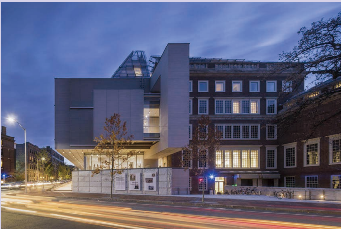
哈佛大学艺术博物馆