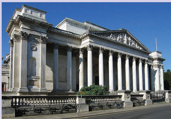
剑桥大学非茨威廉博物馆