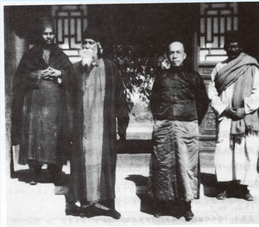
1924年，梁启超接待来华访问的印度著名诗人泰戈尔

不欲生，然或念及妻儿，辄有难于一死不能自克者。若能摈私欲尚果毅，自强不息，则自励之功与天同德，犹英之“劲德尔门”，见义勇为，不避艰险，非吾辈所谓君子其人哉？！