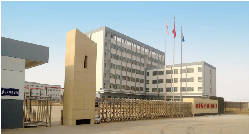
石家庄诚志永华显示材料有限公司

世界各国功能材料研究极为活跃，新技术、新专利层出不穷。功能材料研究领域充满了机遇与挑战，发达国家企图通过专利权的形式在特种功能材料领域形成技术垄断，功能材料已经成为又一个没有硝烟的战场。诚志股份不畏困难，勇于承担高端功能材料国产化的重任。诚志股份的