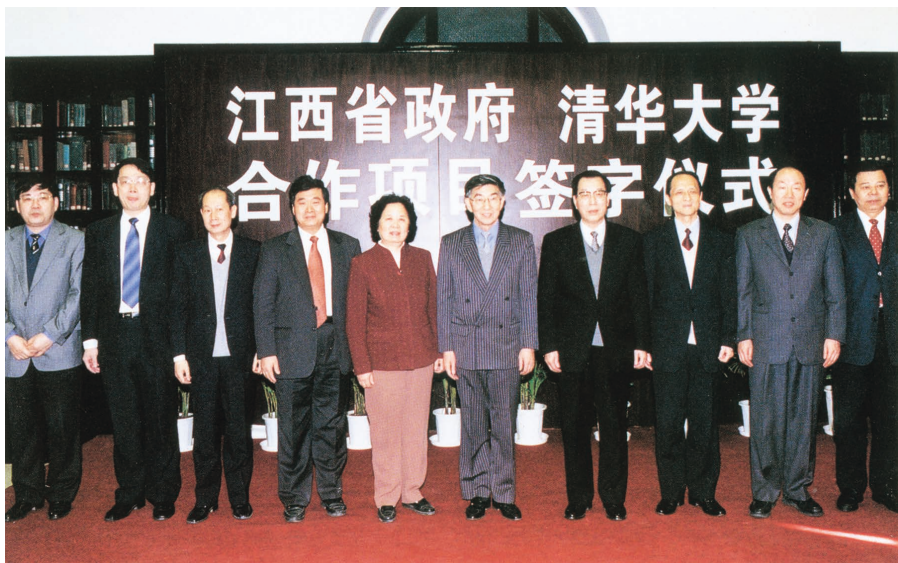
1997年11月，清华大学与江西省正式建立了省校全面合作关系

从诞生之初，诚志股份就肩负着探索产、学、研一体化、加快科技成果向生产力转化、利用高科技改造和提升传统国有企业竞争力等重大使命。诚志股份的领导集体紧跟中国和世界经济发展趋势与产业动向，审时度势，前瞻性地制定了适应公司不