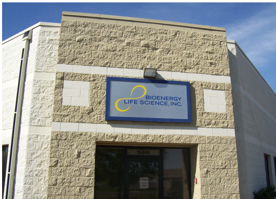
诚志（美国）生物能量生命科技有限公司