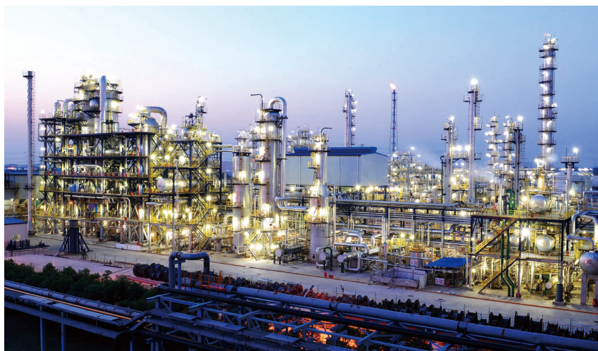
南京诚志园区夜景及厂区图，此厂区为无人厂区

经过十余年的发展，依托清华大学的产、学、研优势，诚志股份已经在临床医学和诊疗服务、生命科技，以及液晶材料的研发、生产和销售积聚了先发优势和核心竞争力。2016年底在南京诚志清洁能源股份有限公司（以下简称“南京诚志”）