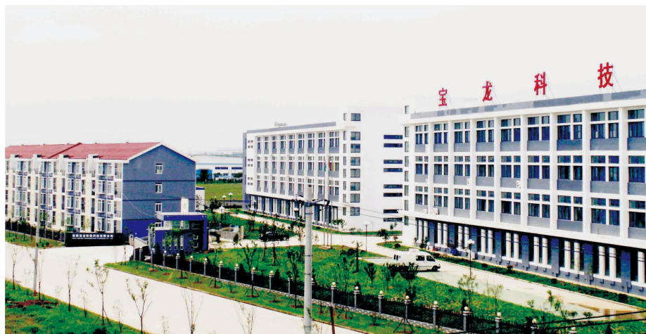
安徽宝龙环保科技有限公司致力于机动车尾气激光遥感监测仪器的研发、生产、销售及服务

市场为导向，贴近市场需求所在地，为下游客户布局配套生产。在业务运营方面，坚持精细化运作，打造循环生产体系，提高原料及中间产品的利用效率，实现高效可持续发展。在此基础上，南京诚志实行“横向和纵向”并重的发展战略：坚持产业园区经营模式，为大型化工企业提供综合原料配套，战略性选择其它产业园区复制现有的经营模式；纵向上则有选择地拓展下游产品链条，提升产品附加值。