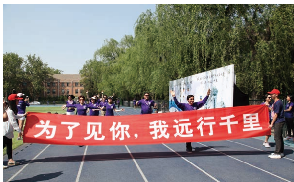
82 级校友跑回清华园

为迎接毕业 30 年，北美清华 1982 级校友策划了“为了见你，我远行千里——大学毕业 30 年，一起跑回清华园”主题长跑活动。参与者分别在不同的国家和城市，以长跑、游泳、滑雪等可计算距离的运动方式，从里程上“跑”回母校，长跑活动持续将近半年时间，从北美扩展到欧洲、大洋洲、亚洲等多个国家和地区，开启了 1982 级海外校友回国的万里征程。200 余位校友踊跃参与，最长的支队跑了两万余公里。在校庆日之际，他们又纷纷从海外专程回到母校，为此次长