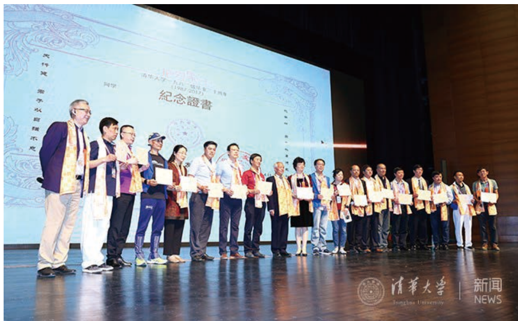
校友们领取《毕业 30 周年纪念证书》