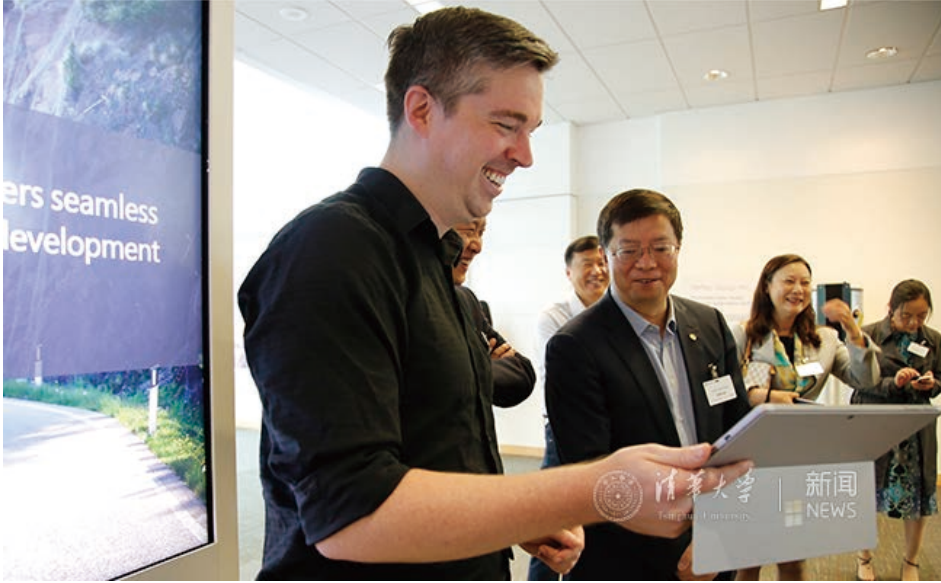
访问微软公司并参观实验室