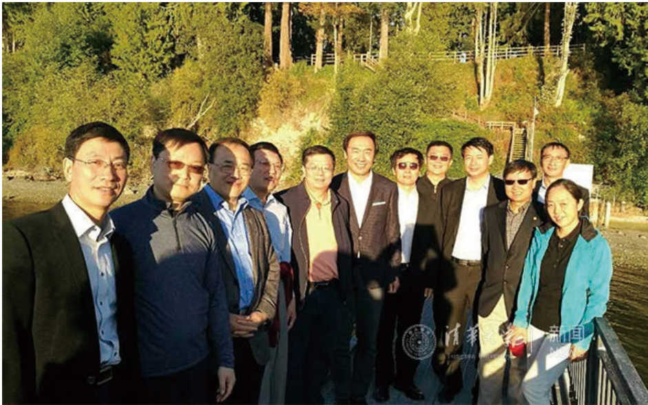
在恳谈会后与部分校友代表合影