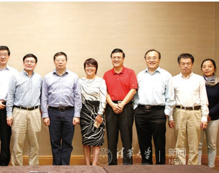
教师座谈会与会人员合影

之间合作的新模式。邱勇表示，希望今后继续推进与微软在人才培养、联合研究、研究人员交流等方面的合作。