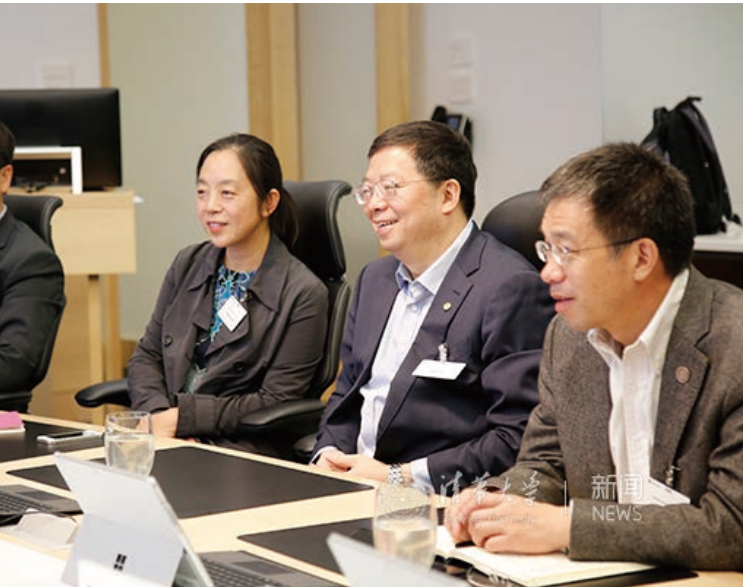
与微软及亚马逊高级研究人员座谈交流