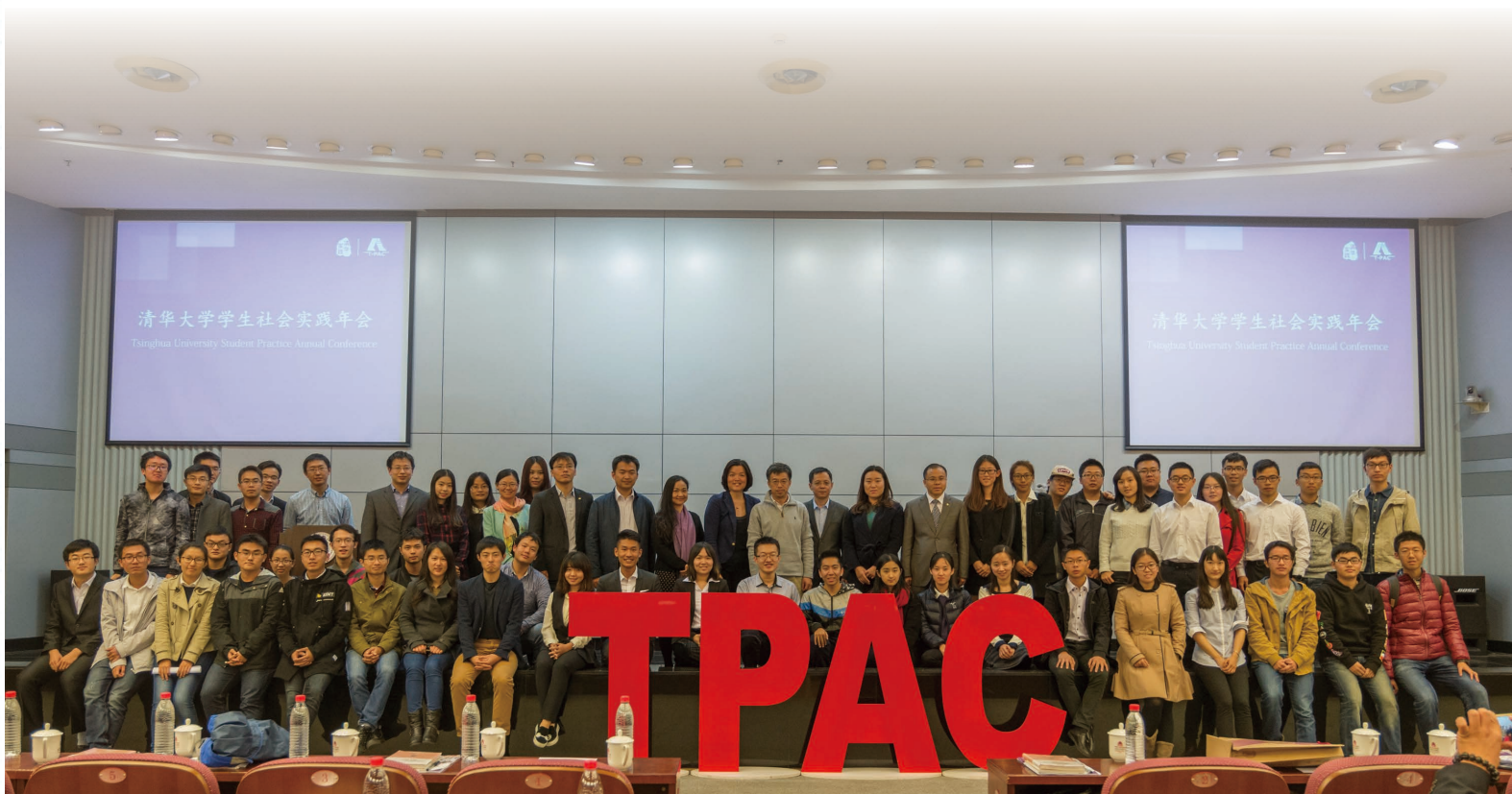
TPAC 实践总结年会合照

在广大校友以及社会各界对清华大学学生社会实践的支持下，在过去的 2016~2017 学年当中，寒暑假期间本科生出行支队 700 多支，33 个省、自治区、直辖市，亚洲、非洲、欧洲、北美、南美等五大洲 20 多个国家，都在今年的寒暑假期间留下了清华人的足迹。