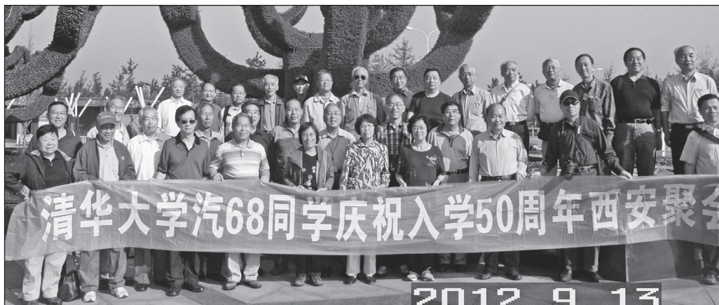
2012年9月，汽8班在西安聚会