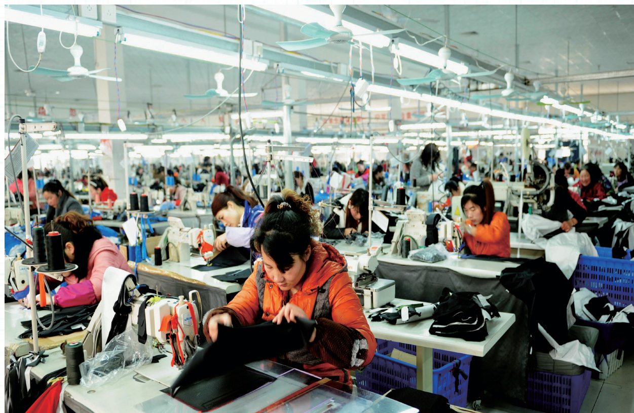
2015年12月9日，世界银行发布题为《福寿延年：东亚与太平洋地区的人口老龄化》的报告，报告中称东亚地区老龄化速度之快历史罕见，致使劳动年龄人口比例大幅下降，仅中国到2040年前将减少9000万劳动年龄人口。在短短二三十年间，65岁及以上人口在该地区总人口中所占比例从7%上升至14%。从2015年至2034年，东亚地区65岁以上人口5年平均增速将为22%

根据世界卫生组织的定义：一个国家或地区在60岁以上的人口比例达到10%，65岁及以上的人口比例达到7%以上，即可被称为老龄化的社会；65岁及以上的人口比例达到14%即可称为