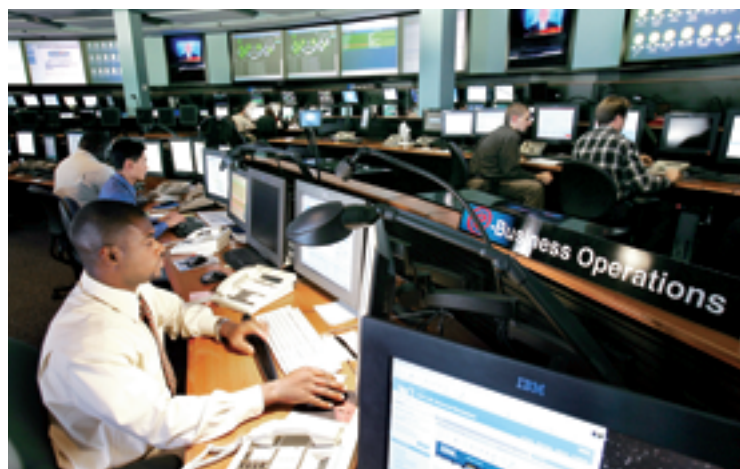
IBM系统控制中心，安全专家在监测互联网上的攻击和潜在的威胁，以保障遍布全球34个国家的500强企业及各国政府的计算机系统安全

迄今，统计物理中的平均场方法在复杂网络科学中被普遍应用，平均场方法不仅适用于从连续相变和临界现象的研究，而且成为研究复杂网络的有力武器，例如被应用于求解网络理论模型中的度分布等拓扑特性，首先，Watts-Strogatz（WS）小世界模型和Barabasi-Albert（BA）无标度模型中，理论上都是以平均场解析为基础的。2000年Newman, Moore 和Watts使用平均场近似对WS小世界模型平均距离的解析推导。