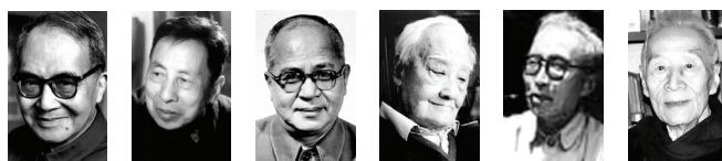
钱钟书 夏鼐 吴晗 赵俪生 李长之 林庚

对西方哲学有很深的造诣，对黑格尔、斯宾诺莎、怀特海等西方近现代哲学家都有深入的研究，同时就中国哲学而言，他又是“新心学”的创建者，被尊为现代新儒学八大家之一。