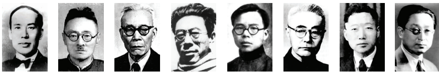
杨振声 刘文典 金岳霖 闻一多 蒋廷黻 顾颉刚 雷海宗 张申府