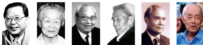
曹禺 杨绛 费孝通 冯契 何炳棣 季羨林