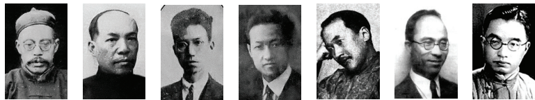
王国维 梁启超 陈寅恪 赵元任 李济 吴宓 朱自清