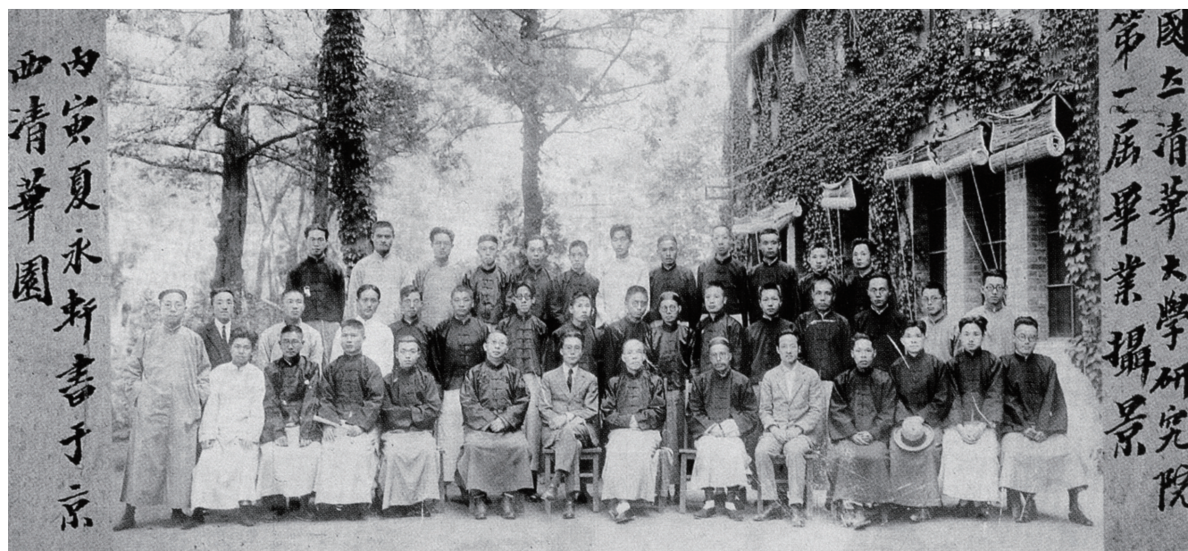
清华大学研究院第一届毕业生合影