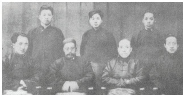
国学研究院教师合影。 前排左至右：李济、王国维、梁启超、赵元任； 后排左至右：章昭煌、赵万里、梁廷灿

当然，单纯继承中国传统学院的优点远远不能造就清华国学院的“神话”，在新文化运动思潮的大背景下，清华国学研究院的成立更是充分借鉴了西方学院的教学模式，吸收西方大学的办学精神和导师制，充分把西方教学中的优势融汇到国学教育之中。