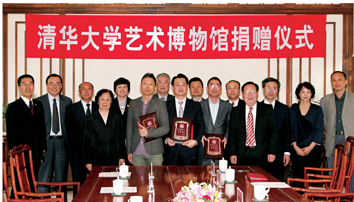
清华大学校长顾秉林（前排右一）、教育基金会理事长贺美英（前排左一）与张朝阳（前排左二）、施锦珊（前排左三）、莫天全（前排右二）合影