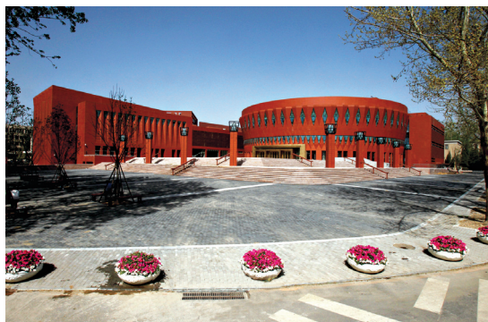
新清华学堂和校史馆远景

二是必须努力培养世界一流的学生。我们所要培养的世界一流学生，应当不仅有扎实的学术基础和学术创造力、国际竞争力，而且有报效祖国的远大志向和宽广胸怀，有文理兼修、德才兼