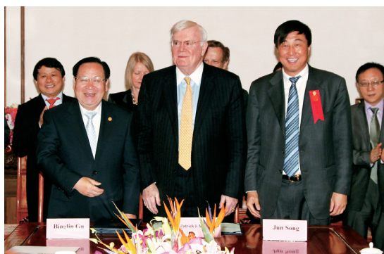
IDG创始人兼董事长、MIT麦戈文人脑研究院创始人麦戈文先生（前排中）、清华大学校长顾秉林（前排左一）、教育基金会副理事长兼秘书长宋军（前排右一）共同签署捐建协议

4月22日，美国国际数据集团（IDG）与清华大学签署清华大学—IDG麦戈文人脑研究院捐建协议，根据协议，IDG将捐赠1000万美元与清华大学共同建设清华大学-IDG/麦戈文人脑研究院。此外，IDG及IDG资本管理团队还将分别设立“IDG中国基金会”和“和谐基金会”，为该研究院提供长期支持与资助。