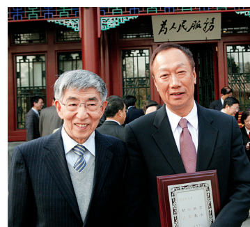
郭台铭（右）与原清华大学校长王大中

10年前郭台铭先生向清华捐资成立清华—富士康纳米科技研究中心，10年来已取得累累硕果，是产学研相结合的技术创新体系的典范。富士康此次对清华大学继续捐赠10亿，将进一步深化双方合作层次与内涵，合作视野将扩展到人文相关项目、杰出人才引进、学术交流、校际合作、在校学生的创业奖励或育成中心之创设，给创新型人才提供一个良好的发展环境。