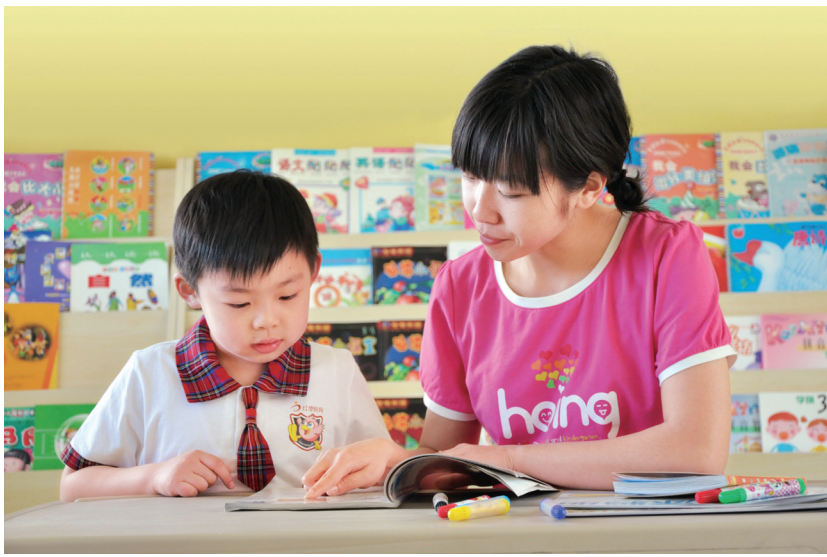
红缨幼儿园的老师和孩子一起阅读