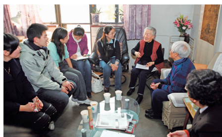
杨绛（右3）与“好读书奖学金”获得者

1994年~2009年，清华大学教育基金会累计筹款20亿元，累计项目支出12亿元（详见下表）。2009年共筹款4.08亿元，来自大陆地区的捐赠占46.68%，来自港澳台地区的占12.97%，其中校友捐赠比例占16.58%，捐赠项目中有52.29%为基建项目，教育基金、研究基金及奖助学金等项目也都占有较大比重。目前，清华大学教育基金会在北京、香港地区、日本、美国等国家均设有办事机构，资助项目有奖助学金、励学金、研究基金、人才基金、校园建设、社会公益等类别，在资源开发、项目管理、资金运作、团队建设等方面都名列国内高校基金会前茅。