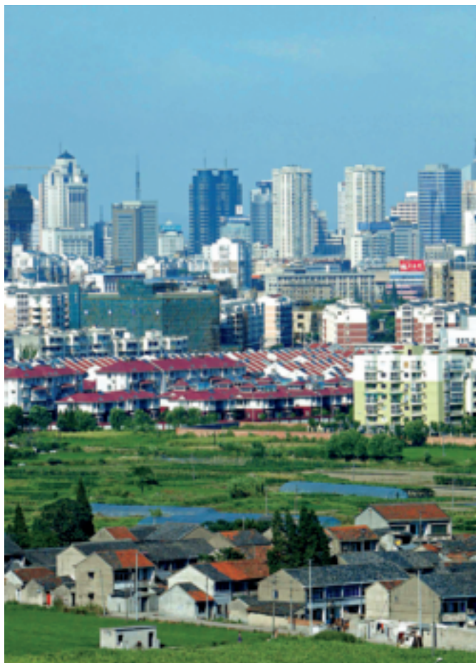
浙江宁波的农村正在融入城乡一体化

“十二五”期间，培育和发展动态比较优势，通过制度创新和技术进步，将依赖于增加要素投入的粗放型经济增长方式，逐步转向更多依靠技术进步和人力资本提升、更多依靠提高要素产出效率和资源配置效率的创新驱动、内生增长的集约式经济增长方式。与此相对应，通过提高自主创新能力、谋划和布局战略性新兴产业，培育和发展我国动态比较优势。