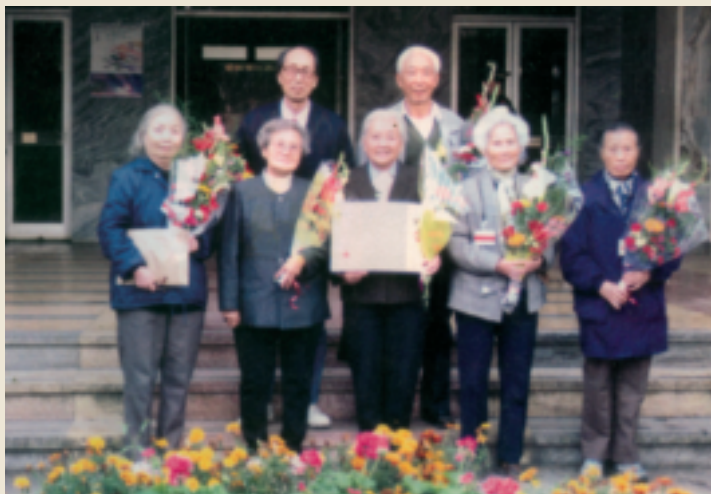
西南联大希望小学的发起校友

截至2010年5月，祖国西南三省一市、西北四省、中南六省、华东两省、华北四省用他们的捐赠分别新建成了15所、5所、6所、2所、4所希望小学。