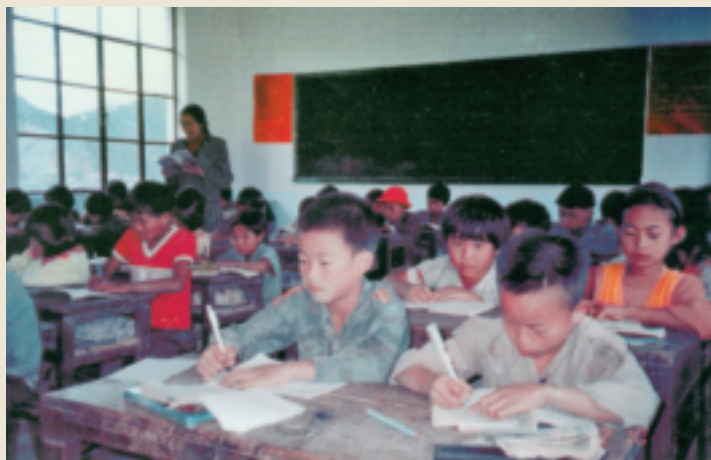
学生正在新教室里上课（景东西南联大前所希望小学）