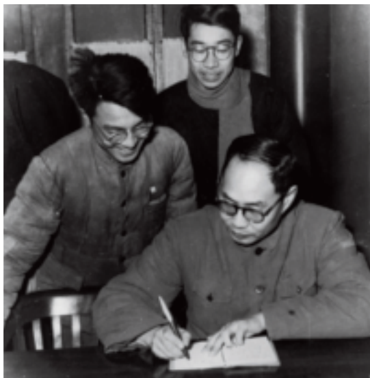
1961年蒋南翔给志愿去边疆的学生题字