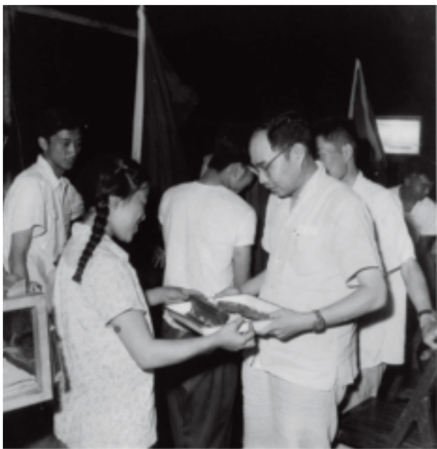
1960年南翔在接受铸9“长工班”学生制作的球墨铸铁车轨的献礼

他十分关心辅导员的成长，让第一批辅导员组织起来学习《实践论》、《矛盾论》，努力学会运用辩证唯物主义和历史唯物主义的观点去观察社会、分析问题、指导工作，并亲自辅导。许多同志回忆这段经历时，都感到在政治上受益匪浅。他也叮嘱大家一定要同时把业务学习学好，有些辅导员后来还被选派到国外学习、进修。实际上，这个时候南翔同志就已经提出了“双肩挑”的思想。