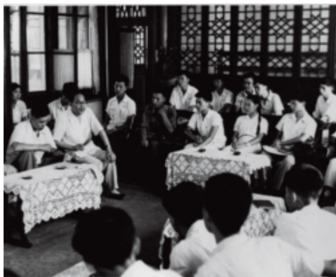
1961年7月蒋南翔和优秀毕业生座谈

随后，每年都要从高年级学生党员中选拔一批新辅导员，补充学生的政工干部队伍，后来也有一部分辅导员由青年教师中的党员担任。在1958年以前，对辅导员的挑选是严格的，制度执行得比较好。在“大跃进”的年代里，学校大发展，所需辅导员的数量陡然增长，曾经出现过对人员挑选不够严格（甚至从低年级学生中抽调）以及工作负担过重而影响学习等现象。南翔同志知道以后，都及时采取措施加以解决，从而逐步健全了辅导员制度。从1953年到1966年，清华先后共选拔培养了682名辅导员。他们为学校的学生思想政治工作付出了辛勤劳动，作出了积极贡献。“文革”期间，这些同志竟被批判为“推行修正主义路线的基本力量”，而倍受摧残。粉碎“四人帮”后，学校党委很快恢复了半脱产的政治辅导员制度。这说明，南翔同志倡导的辅导员制度是有生命力的。邓小平同志在1978年6月对这一创造给予了充分肯定：“清华过去从高年级学生和青年教师中选出人兼职做政治工作，经过若干年的培养形成了一支又红又专的政治工作队伍，这个经验好。”现在这个经验已被一些高校采用。