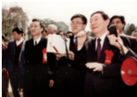
学院成立十周年大会上发言