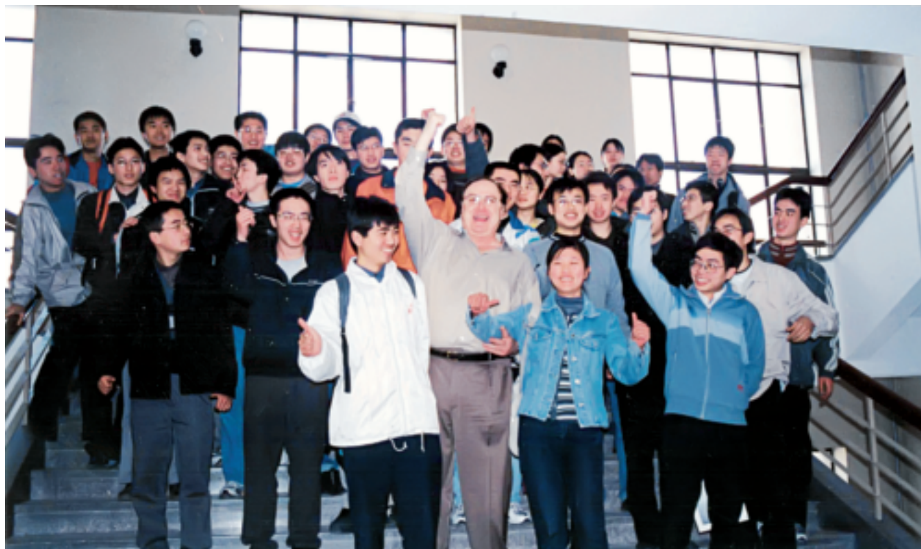
萨文迪教授和学生们在一起

“教学创新奖”；2008年4月，荣获2008年度英国工效学学会主席奖，该奖项每年颁发给世界范围内对人因与工效学领域研究做出突出贡献的单位及其成员，该年度共有3个单位获奖，清华大学工业工程系成为亚洲地区首次荣获该奖项的单位。