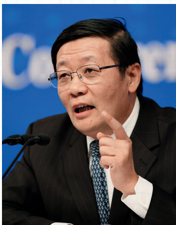
楼继伟，全国社保基金理事 事会会长