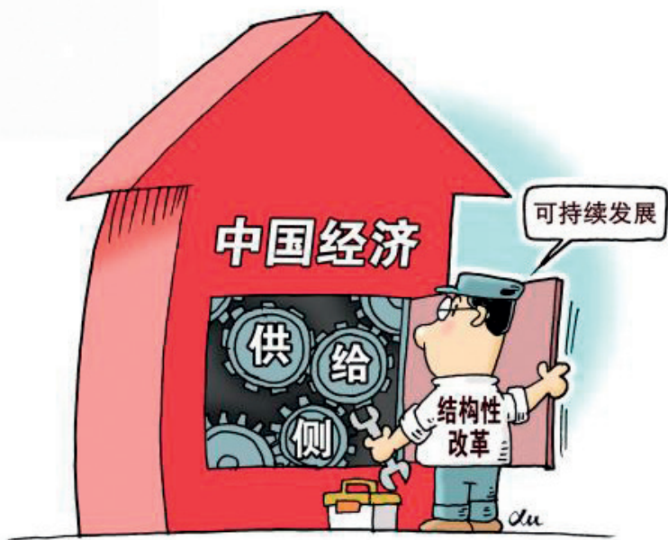
源头入手 徐骏 作

对于第一类的趋势性问题，借助供给侧结构性改革可以做出适当改善，但不可能根本改变。比如，我国劳动力总量从2015年开始净减少并且呈加速态势。2017年，16-59岁劳动人口9.02亿人，比上年减少548万人，比上年多减近200万人。60岁以上人口达2.41亿，比上年增加1000万，占总人口的17.3%，老龄化进一步加剧。放开二孩后，虽然有利于增加人口总量，增加未来劳动力供给，但带来的近期劳动参与率下降又成为对冲因素，最终的结果难以预料。从环境保护和污染治理看，为适应人民群众美好生活需要，逐步加大了工作力度，但在归还欠账的同时，也对GDP增长形成压抑作用。此外，外部环境也面临动荡，贸易保护主义抬头，与经济全球化相互碰撞，短期内很难说“东风压倒西风”或是“西风压倒东风”，这也是我们难以左右的不确定因素。总之，从经济增长角度看，对于这类不可扭转的趋势性问题，供给侧结构性改革的着力点是改善问