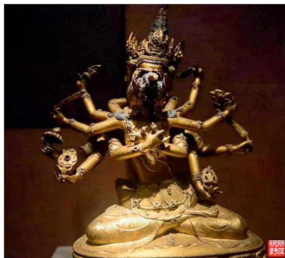
锻铜佛像

第二期的综合性研修班之后，清华美院逐步探索出了专题性和建制制的培训班，前者以传统工艺的门类划分，如第六期的漆器专题班和第七期的青瓷专题班；后者以地区进行划分，如第五期的佛山地区班和第九期的玉树地区班。