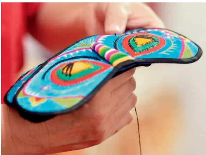
澄城特色的虎头图案眼罩