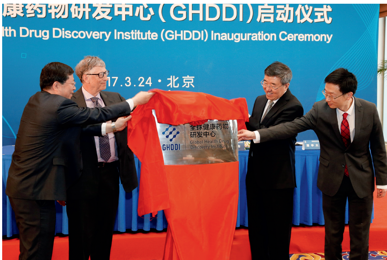
从左至右为：邱勇、比尔·盖茨、隋振江、丁胜为中心揭牌

为了共同应对日益严峻的疾病挑战和健康威胁，世界各国领导人于2015年9月在一次具有历史意义的联合国峰会上通过了2030年可持续发展目标（SDGs），其中第三条即为“确保健康的生活方式，促进各年龄段人群的福祉”，并且提出“到2030年，消除艾滋病、结核病、疟疾和被忽视的热带疾病等流行病，抗击肝炎、水传播疾病和其他传染病”的具体目标。