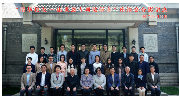
顾秀莲、陈旭等与获奖学生合影

4月20日，“清华校友——康世恩专项奖学金”签约仪式及学生座谈会在清华大学举行。第十届全国人大常委会副委员长、中国关心下一代工程委员会主任顾秀莲，中国关工委常务副主任闵振环，中国关工委副主任、教育部关工委主任李卫红，中国关工委副秘书长温厚文，清华大学校务委员会副主任、关工委主任韩景阳，时任党委副书记、关工委副主任史宗恺等出席。会前，清华大学党委书记陈旭会见了顾秀莲主任一行，并和与会人员合影留念。