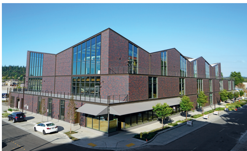
新落成的 GIX 大楼