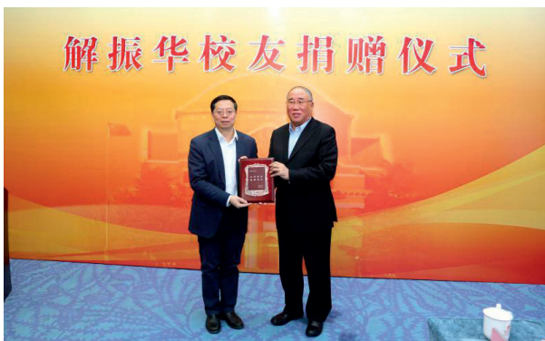
邱勇向解振华颁发捐赠纪念牌

11月3日，中国气候变化事务特别代表、全国政协人口资源环境委员会副主任解振华出席在清华大学举行的捐赠仪式，将其所获“吕志和奖——持续发展奖”2000万港币奖金全部捐赠给清华大学教育基金会。