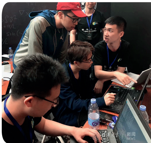
比赛现场参赛同学热烈讨论

竞赛并列为世界最具权威性的三大国际大学生超算竞赛。此次竞赛共有全球300余支高校代表队报名。