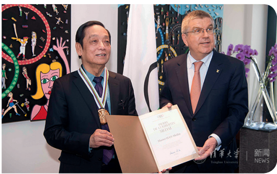
国际奥委会主席托马斯·巴赫（右）给韩美林（左）颁发“顾拜旦奖”

瑞士时间4月24日，在瑞士洛桑国际奥委会总部，国际奥委会主席托马斯·巴赫给中国艺术家、清华大学美术学院教授韩美林颁发了“顾拜旦奖”。这是韩美林继2015年在中国美术界首次获颁联合