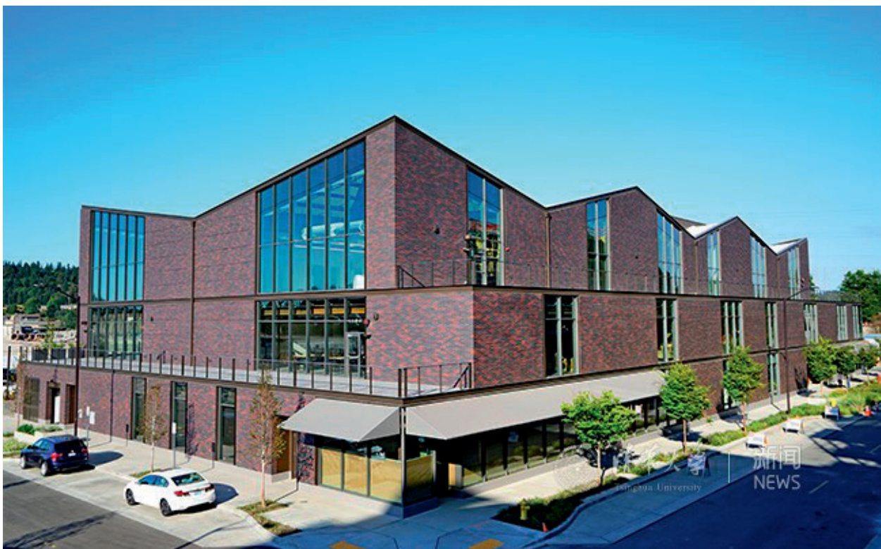
全球创新学院大楼外景

一种健康的正确的思想。”清华人在建校初期，就将自身的精神世界与中华民族的精神世界紧紧联系在一起。