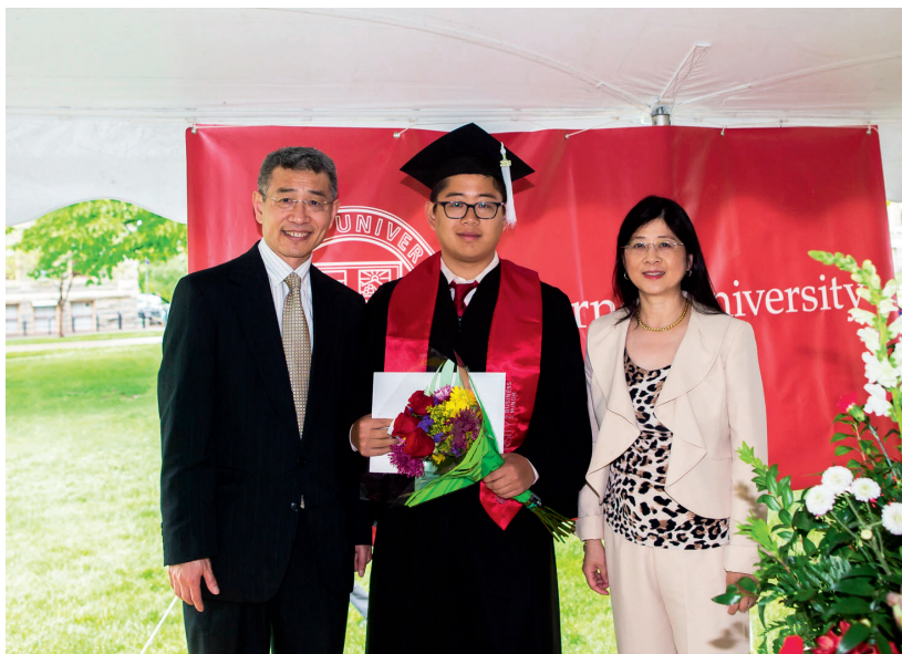
参加大儿子的毕业典礼

大学毕业活动请名人来讲演，是美国几乎所有学校的传统。美国现任和前任总统、国外的领袖、大公司的总裁、著名政治家、艺术家、政治评论