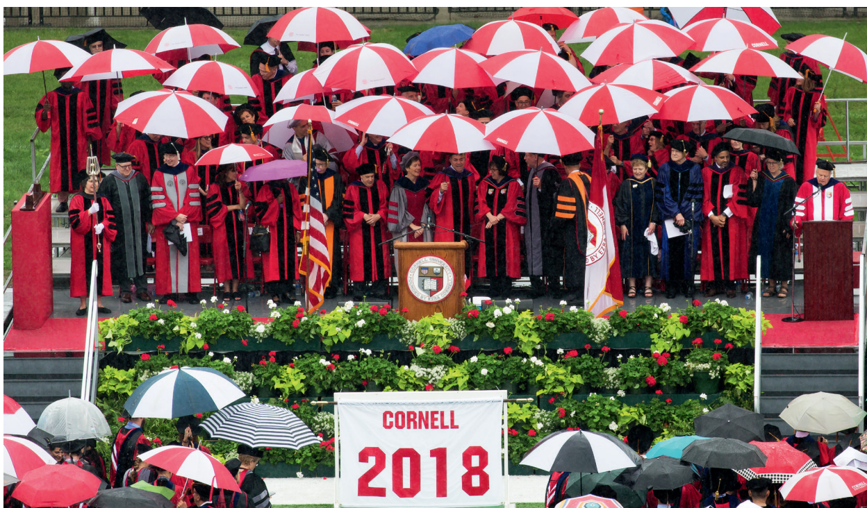
雨中的康奈尔大学毕业典礼