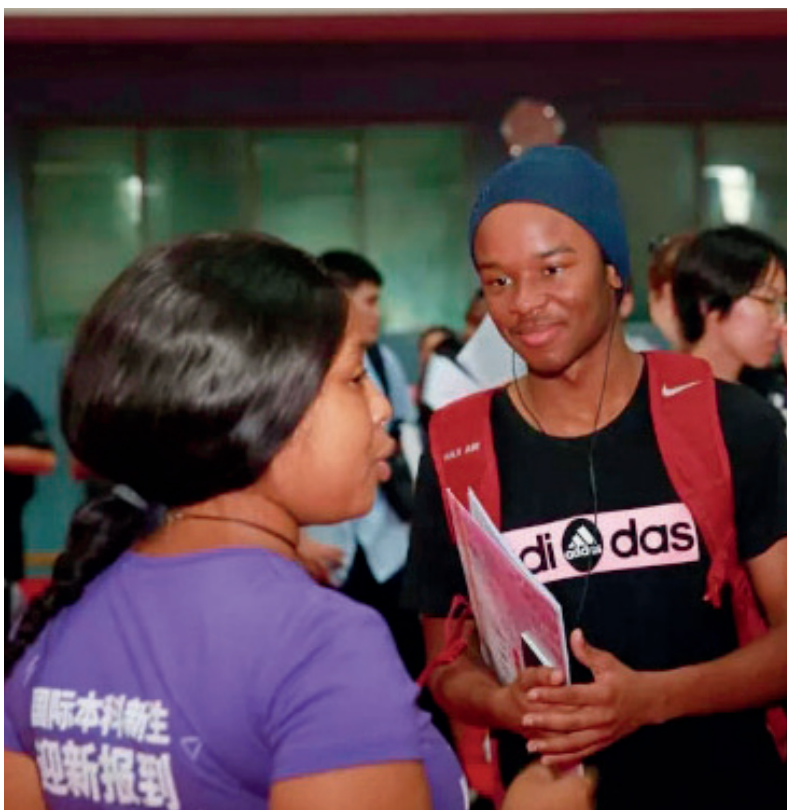
国际学生在新生报到现场

今年，清华大学继续在浙江推行“三位一体”综合评价招生，在上海推行领军计划招生，录取生源质量继续稳居全国高校首位。