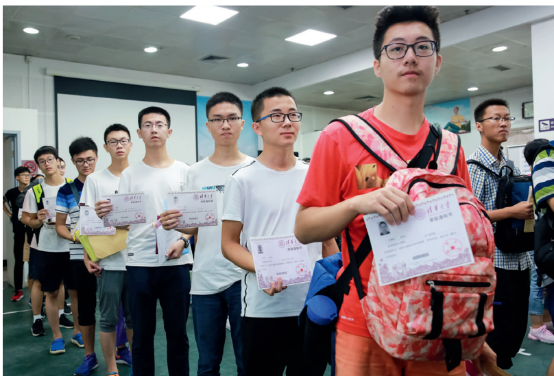
2018级新生报到现场

今年，清华大学各类型自主招生共收到3万多份有效申请材料，通过专家组评审后，共有6000多名同学脱颖而出进入初试环节，2000多名同学参加复试。通过各类型的自主招生，一批批认同清华选人育人理念，具备创新潜质、综合素质领军的考生脱颖而出。他们在高考的舞台上攀蟾折桂，在奥林匹克的赛场上摘金夺银，在艺术的道路上勇敢追梦。