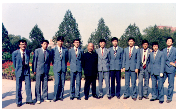
1984年国庆35周年时的军乐队短号声部