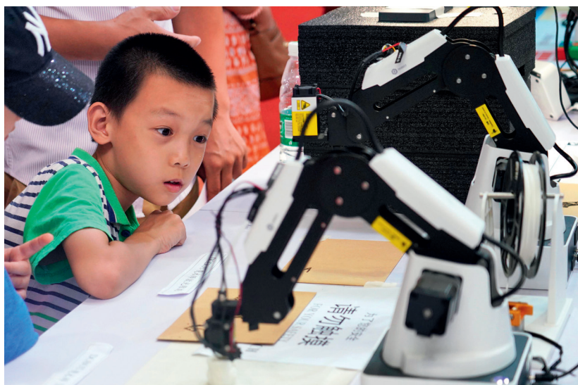
2018年北京举办的世界机器人大会上，小观众在好奇地参观