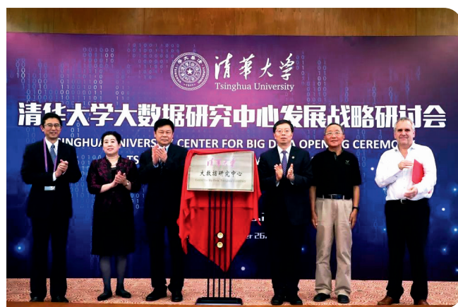
杜占元、高瑞平、邱勇、孙家广、迈克尔·乔丹和方红卫共同为研究中心揭牌

士、孙家广院士、迈克尔·乔丹院士和清华大学科研院院长方红卫共同为研究中心揭牌。邱勇分别向孙家广和迈克尔·乔丹颁发了大数据研究中心主任和学术委员会主任聘书。