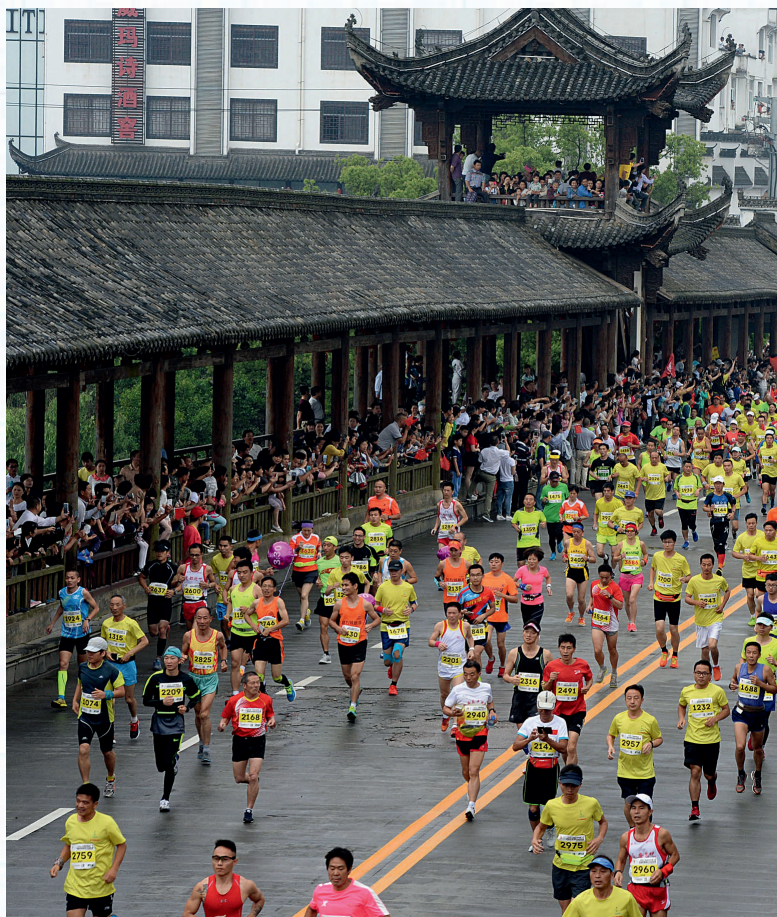
2016年5月15日，选手在比赛中从婺源县城的一处景观桥上经过。当日，首届婺源国际马拉松赛在江西婺源举行，比赛吸引了来自中国、美国、日本、肯尼亚等多个国家和地区的15000余名选手参与全程马拉松、半程马拉松和迷你马拉松等项目的角逐。

中美贸易争端之后，也迫使我们去做一些思考，怎样才能更好地加强与其他经济体的经贸关系，包括发达国家中的欧洲和日本，包括“一带一路”国家。当然，很多一带一路国家的市场还需要培育，怎样才能更好地培育他们的市场能力