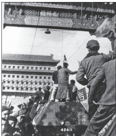
1949年2月3日，清华学生在前门大街站在坦克上欢迎解放军入城

1949年1月31日北平和平解放，2月3日，举行解放军入城式，清华师生组织了“清华迎接解放入城宣传服务队”，共有学生二千多人，教职工二百多人参加。当天黎明进城，在前门火车站与解放军的机械化部队会合，由正阳门入城游行，大家欢呼跳跃，非常高兴。随后，这一批人留在城里两周时间，广泛开展宣传与建政工作。建政就是建立新政权。后来，这两