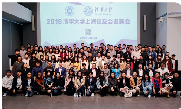
2018年清华大学上海校友会迎新会合影

会上，三位不同年龄、来自不同领域的优秀校友代表就各自的人生经历及感悟进行了分享。