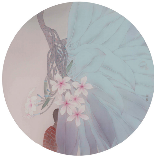
▲ 静观 之二