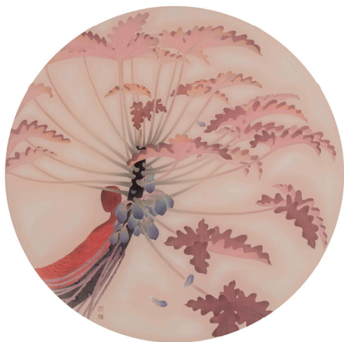
▲ 静观 之四