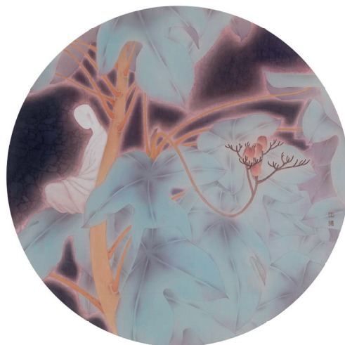
▲ 静观 之五