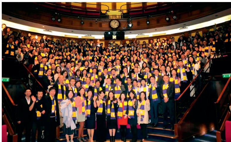
大会与会师生和校友合影