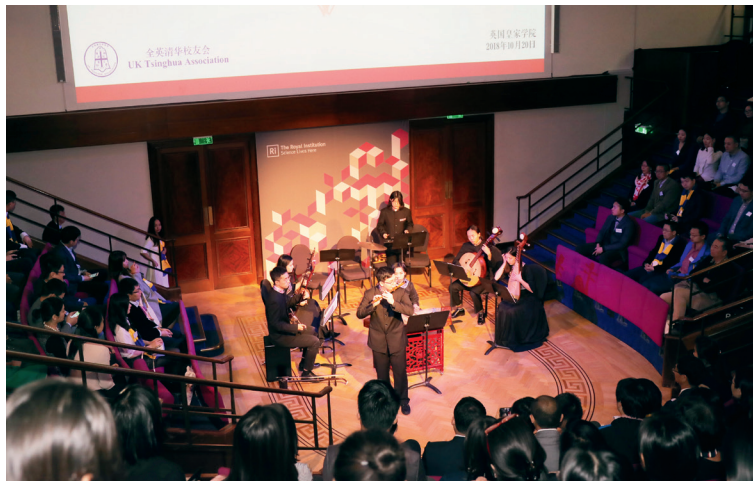
清华大学学生艺术团民乐队演出

主题论坛环节分三组，16 位嘉宾分别从教育、科技和金融几个方面，深入探讨了全球化进程中中国崛起和中欧合作的机遇与挑战，以及清华大学和清华学子在其中所承担的责任和扮演的角色。