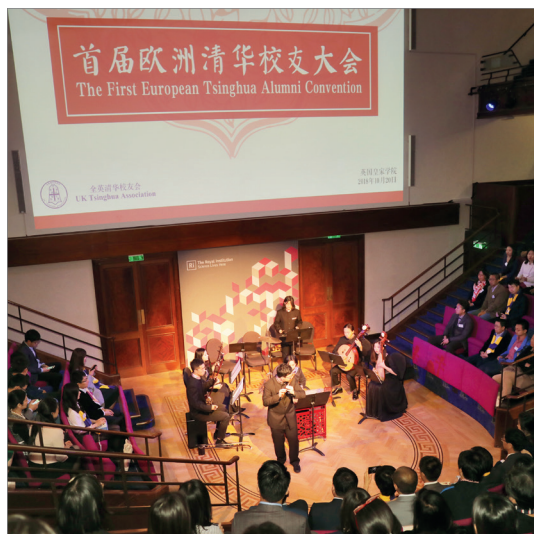
清华大学学生艺术团民乐队演出